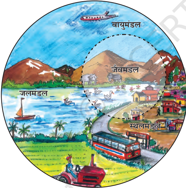
चित्र 1.2 : पर्यावरण के क्षेत्र

स्थलमंडल वह क्षेत्र है, जो हमें वन, कृषि एवं मानव बस्तियों के लिए भूमि, पशुओं को चरने के लिए घासस्थल प्रदान करता है। यह खनिज संपदा का भी एक स्रोत है।