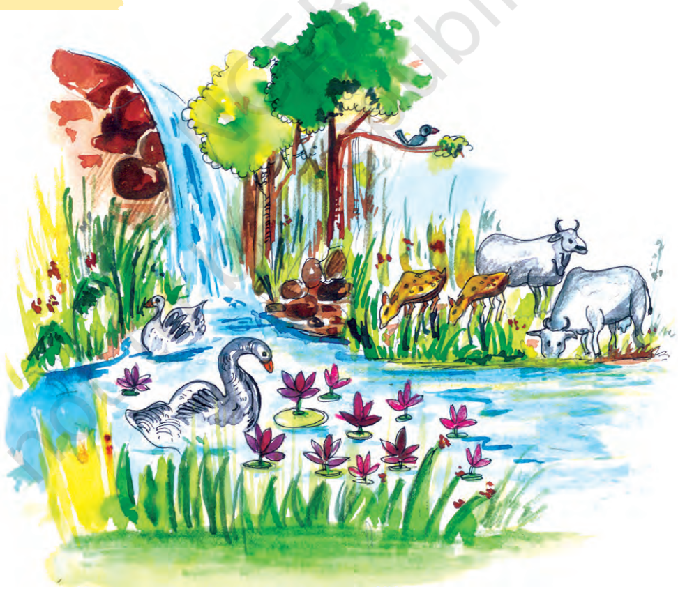
चित्र 1.3 : एक ताल का पारितंत्र

तभी जैसलमेर के रहने वाले हीरा ने आश्चर्य से कहा, “हमारे यहाँ वर्षा होती ही नहीं है। हमें तो दूर-दूर तक केवल कीकर एवं रेत ही नज़र आती है।” “लेकिन वहाँ ऊँट भी तो मिलते हैं,” रवि ने कहा।